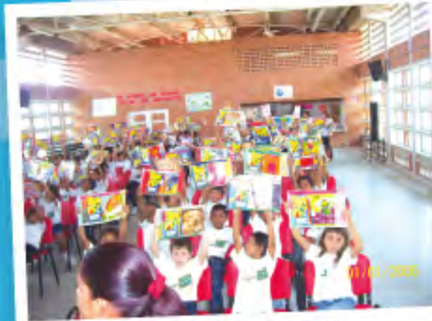
Donación kits escolares Fa y Alegria