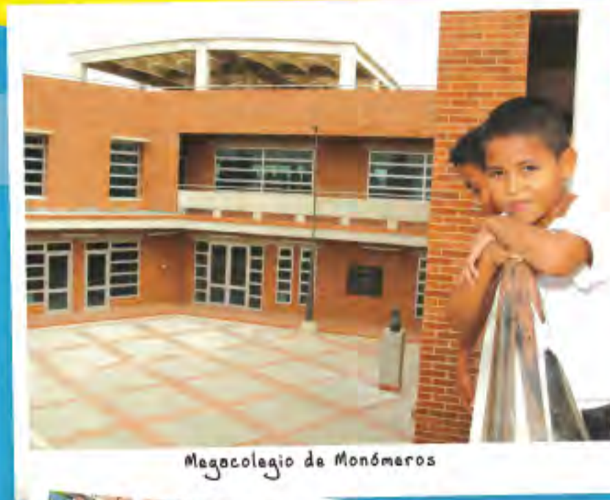
Megacolegio de Monómeros