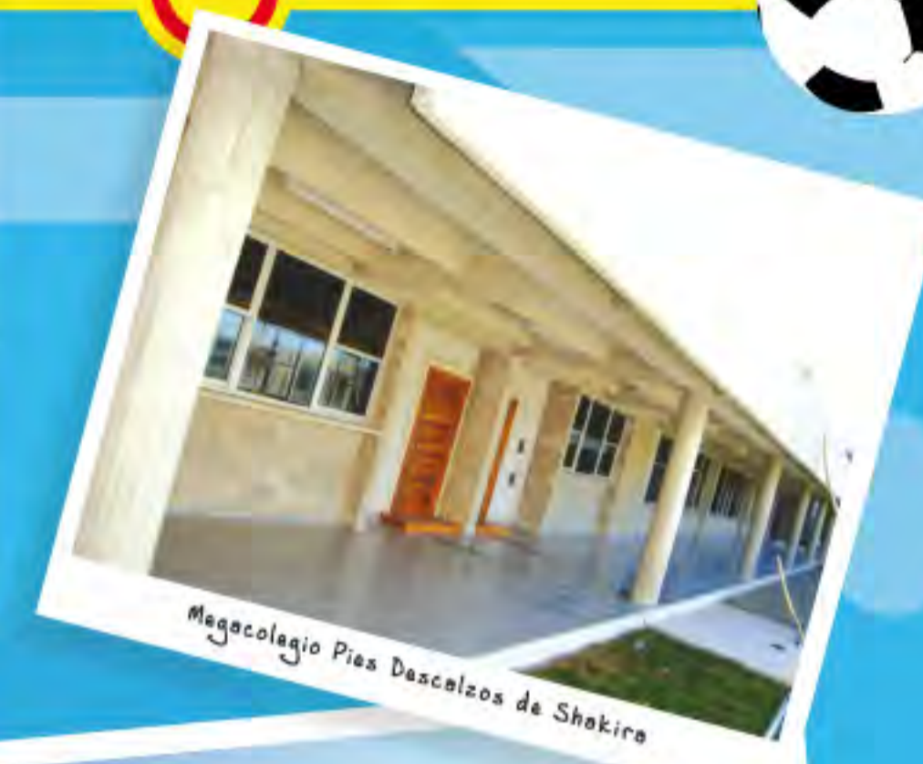
Megacolegio Pies Descalzos de Shakiro