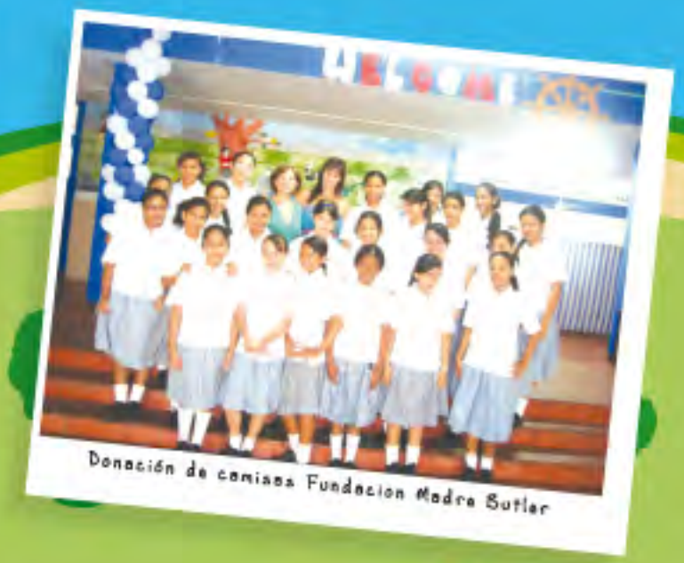
Donación de camisas Fundación Madre Butler