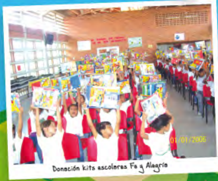
Donación kits escolares Fa y Alegria