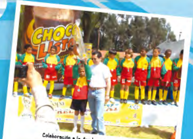
Colaboración a la Academia Barranquillera Infantil de Fútbol