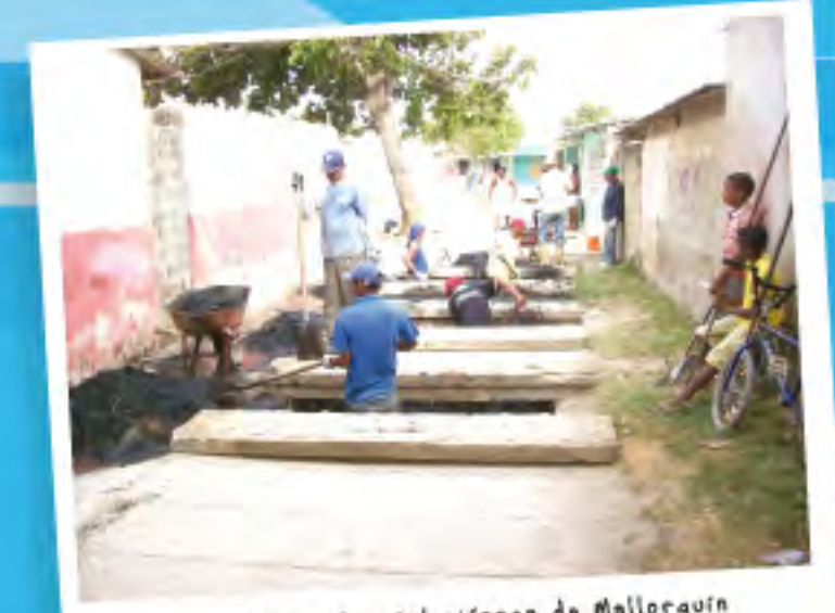
Campaña ambiental ciénaga de Mallorquín