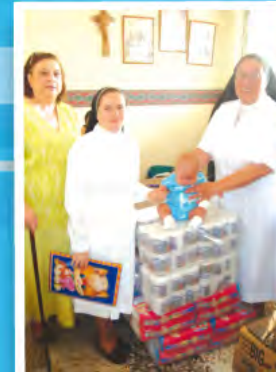
Donación De Elementos De Aseo Y Pañales Al Hogar Santa Elena