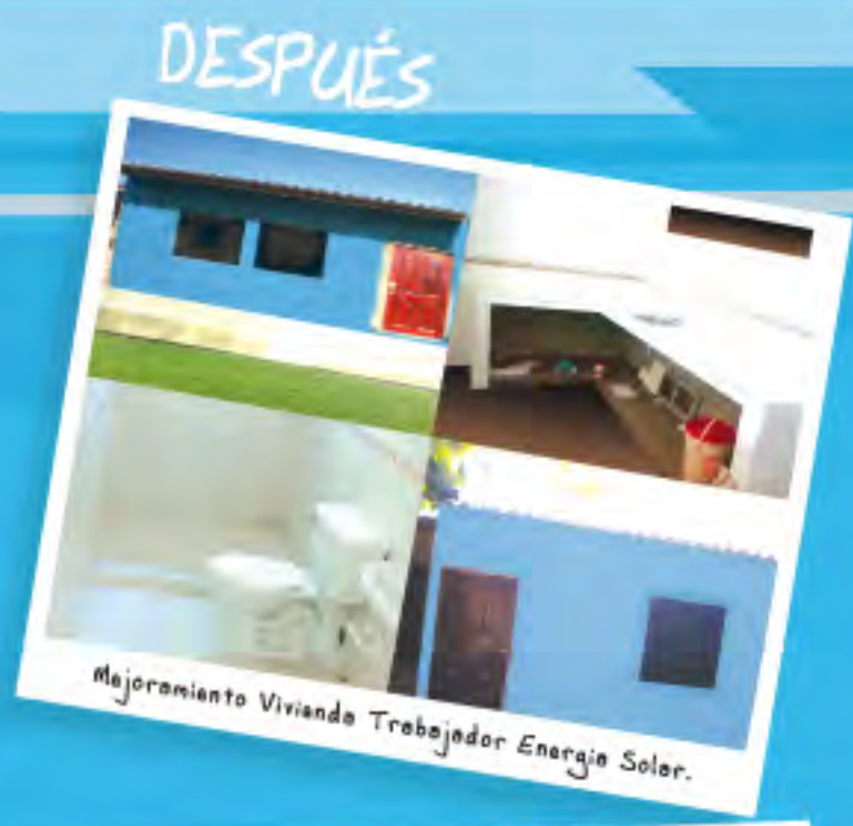
Mejoramiento Vivienda Trabajador Energia Solar.