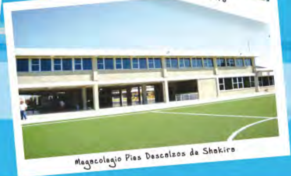
Megacolegio Pies Descalzos de Shakiro