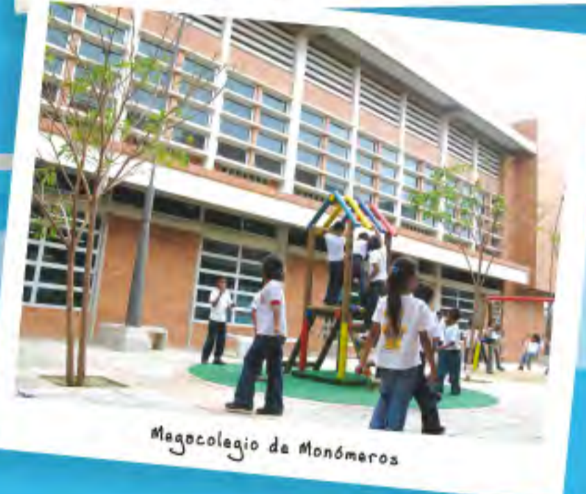
Megacolegio de Monómeros