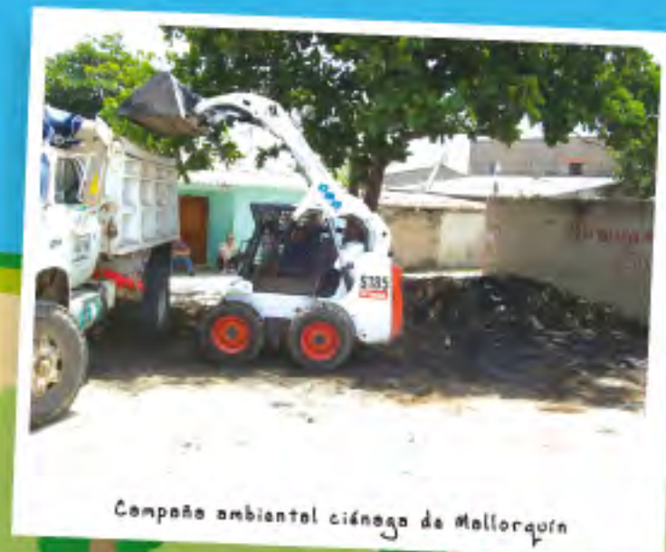
Campaña ambiental ciénaga de Mallorquín