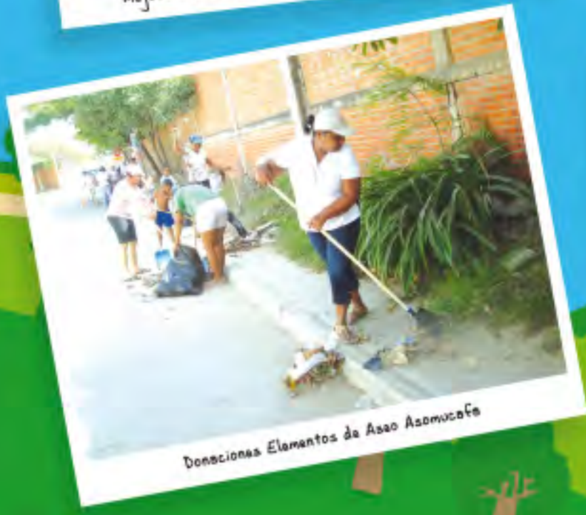
Donaciones Elementos de Aseo Asomucafa