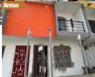
Remodelación y adecuación de la fachada.