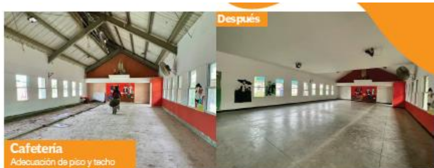
Cafetería Adecuación de piso y techo