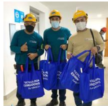
Entregamos kits escolares a hijos de empleados que más necesitaban nuestro apoyo durante el inicio de la temporada escolar.

4,000 KITS ESCOLARES ENTREGADOS EN EL 2022