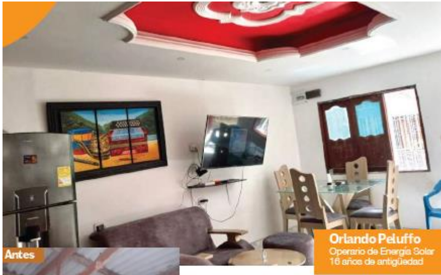
Oriando Peluffo Operario de Energía Solar 16 años de antigüedad