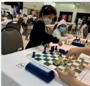
Torneo organizado por la Fundación A la Rueda Rueda.