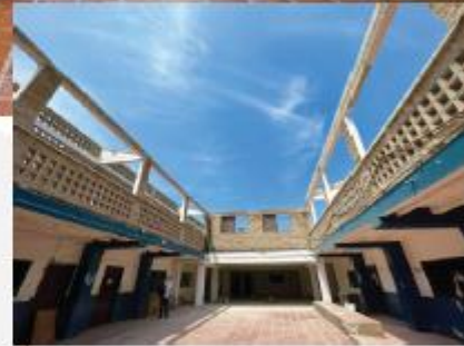
Remodelación y pintura de las áreas comunes del centro educativo.

Para seguir fomentando el deporte como una de las actividades principales de la institución, entregamos una cancha de bola e trapo para que los niños puedan disfrutar de un espacio sano esparcimiento.