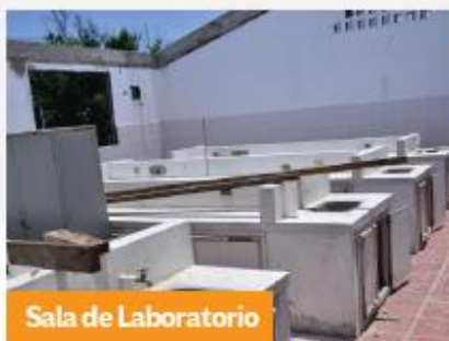
Sala de Laboratorio