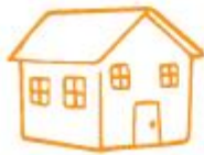
Remodelación total, pintura y techo del interior de su casa.