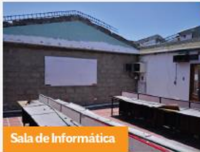
Sala de Informática