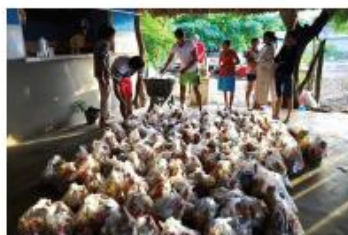
Se entregaron alrededor de 1.000 mercados puerta a puerta.