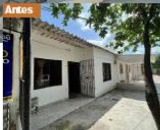
Geyson Pertuz Operario de Techoglass 16 años de antigüedad

Remodelación y adecuación de la fachada de su casa.