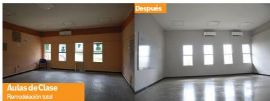
Aulas de Clase Remodelación total