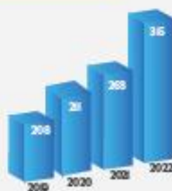
Becados año tras año